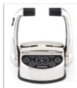
Mando consola doble