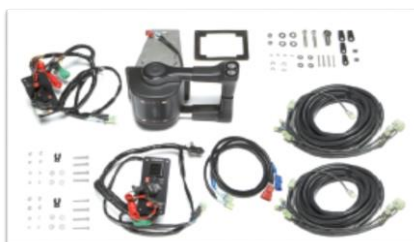
Mando consola superior doble