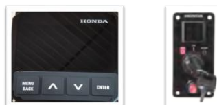
Display multifunción (4.3") + Panel de llaves