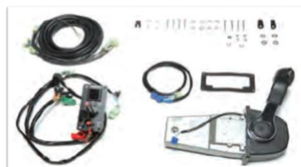
Mando consola superior