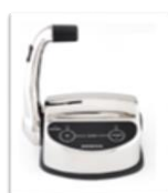
Mando consola simple