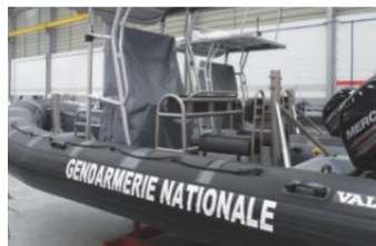
Recambio de flotadores PU Polyuretano.