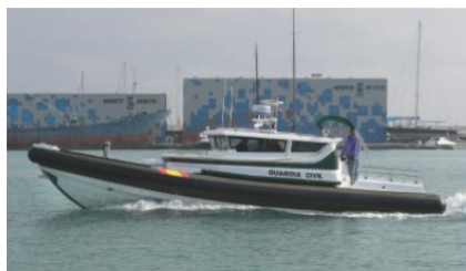
Reparación integral de semirrígidas: flotador, casco y equipamientos.