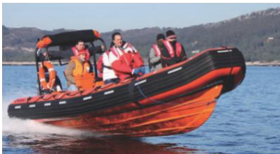
Fabricación de flotadores neopreno Hypalon ® para Pemex.