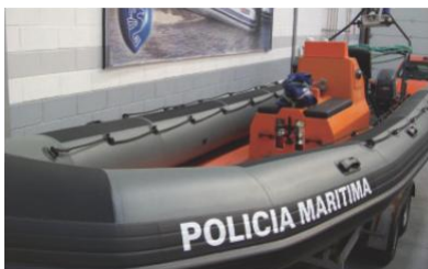
Fabricación de flotadores PU Polyuretano.