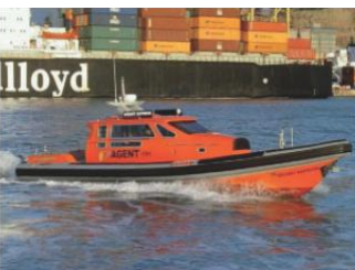
Recambio de flotadores Neopreno/Hypalon ® .